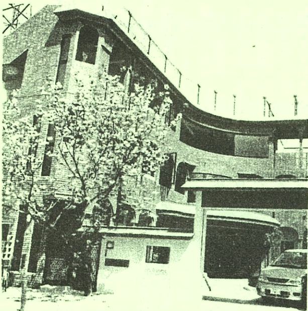
ワークセンター豊新

授産施設ということもあり、「ワークセンター豊新」と銘付けられています。本格的な製パン機器、印刷関連機器、陶芸窯等々が入り、活動を通して地域とつながっていくと準備が進められています。同区内にある福祉作業センター風工房、イーハトーブ風工房、グループホームイー